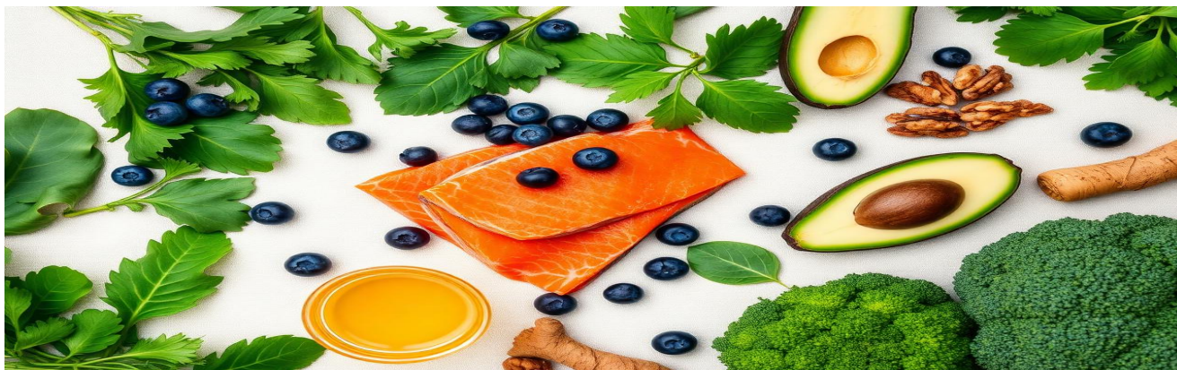
Folhas verdes, peixes ricos em ômega-3, azeite extra-virgem, oleaginosas, frutas vermelhas.

PREDIMED (NEJM 2018): dieta mediterrânea = -30% eventos cardiovasculares.