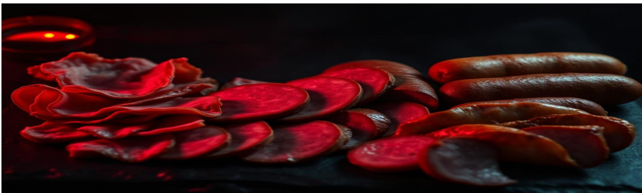
Bacon, salame, salsicha, presunto: o pelotão dos nitritos.

“Há evidência convincente de que causa câncer — especialmente colorretal.”