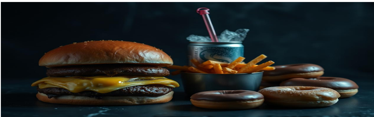
Ultraprocessados: 32 desfechos adversos confirmados (BMJ 2024).

Não existe alimento neutro — cada garfada vota a favor ou contra a sua longevidade.