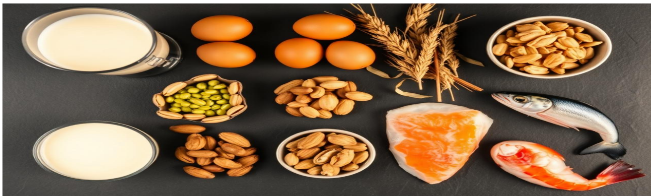
FDA / NIAID — 8 grupos respondem por ~90% das reações alérgicas.

Responsáveis por 90% das alergias alimentares mundiais.